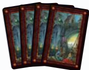
Игровая зона владельца короны