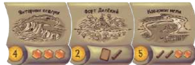
24 жетона маршрута