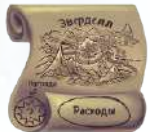
6 стартовых жетонов маршрута