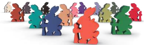
12 фишек зайцев-исследователей (по одному на каждый тип существ в базовой игре и в дополнениях)