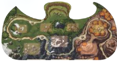
1 поле Острых хребтов