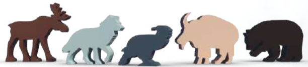
5 фишек крупных существ