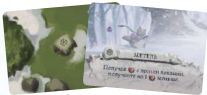
12 карт погоды