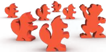
6 фишек лис и 1 фишка посла-лягушки (для дополнения «Жемчужный ручей»)