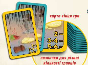
позначки для різної кількості гравців