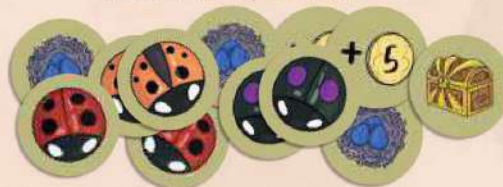
12 жетонів ігрового поля 6 жетонів зачарування (три сумісні пари), 3 жетони гнізда, 2 жетони «+ 5», 1 жетон золоті скрині