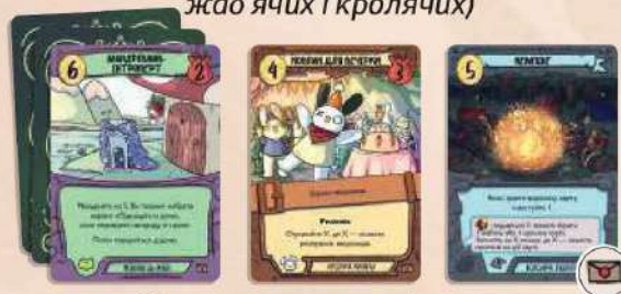
24 карти колоди звісток 15 карт мешканців (по 5 ворон, жаб і кроликів) 6 карт манаток (по 2 воронячих, жаб'ячих, кролячих) 3 карти будівель (по 1 воронячій, жаб'ячій і кролячій)