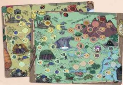
Двобічне ігрове поле (осінній та весняний доки)