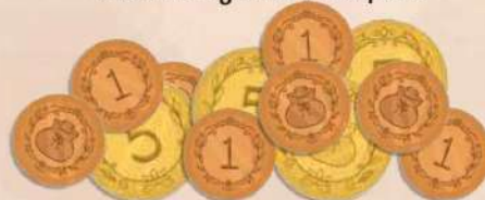
48 жетонів монет / припасів зі значенням 1 12 жетонів монет / припасів зі значенням 5