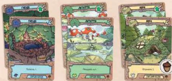
6 стартових карт (2 гнізда, 2 латаття, 2 нори)