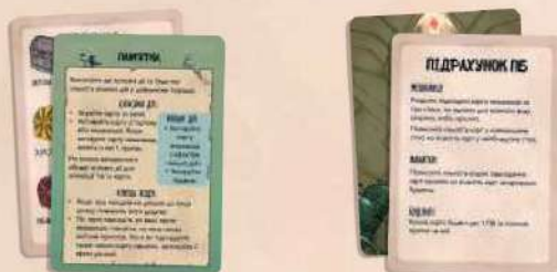
2 карти-пам'ятки 2 карти підрахунку ПБ