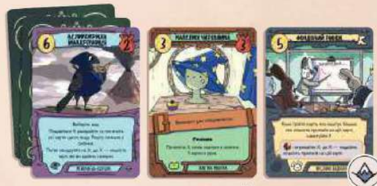
51 карта основної колоди 27 карт мешканців (по 9 ворон, жаб і кроликів) 12 карт манаток (по 4 воронячих, жаб'ячих і кролячих) 12 карт будівель (по 4 воронячих, жаб'ячих і кролячих)