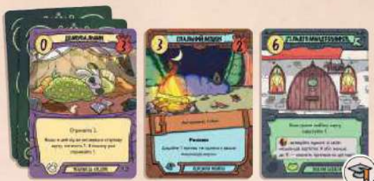
24 карти колоди академії 15 карт мешканців (по 5 ворон, жаб і кроликів) 6 карт манаток (по 2 воронячих, жаб'ячих, кролячих) 3 карти будівель (по 1 воронячій, жаб'ячій і кролячій)