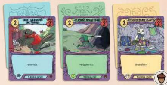
3 початкових карти мешканця (1 ворона, 1 жаба, 1 кролик)