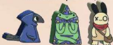
3 мандрівники (по 1 вороні, жабі й кролику)