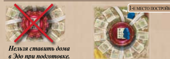
Нельзя ставить дома в Эдо при подготовке.