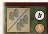
2 или 3 игрока