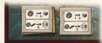
Открытая карта поверх колоды карт торговца. Открытая карта рядом с колодой карт торговца.