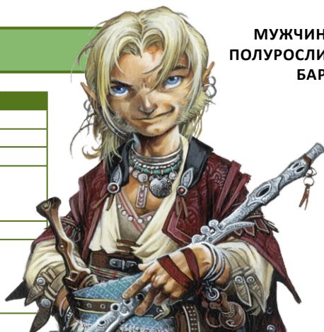
МУЖЧИНА ПОЛУРОСЛИК БАРД