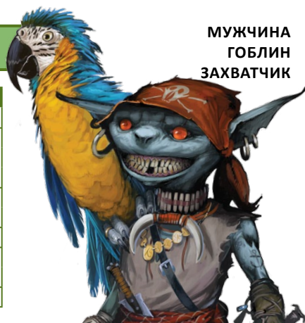
МУЖЧИНА ГОБЛИН ЗАХВАТЧИК