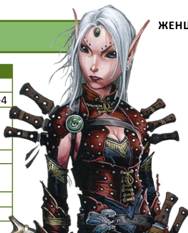
ЖЕНЩИНА ЭЛЬФ ПЛУТ