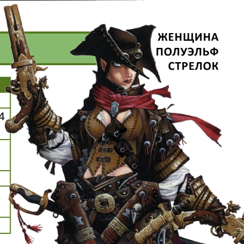
ЖЕНЩИНА ПОЛУЭЛЬФ СТРЕЛОК