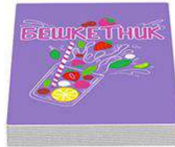
25 карт «Бешкетник»