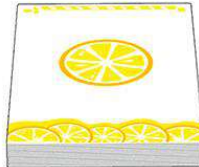
25 карт лимонів