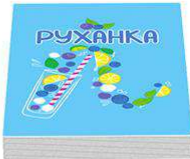
25 карт «Руханка»