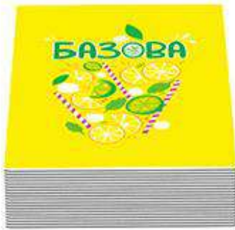
50 базових карт