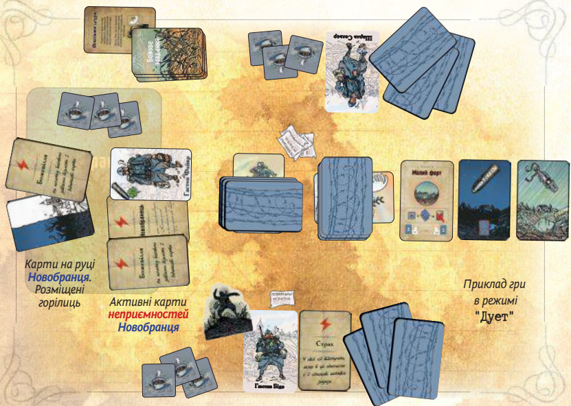
Кarti на руці Новобранця. Розміщені горілиць

Пам'ятайте, що так само, як і в інших гравців, якщо у Новобранця є 4 або більше карт неприємностей (включно з картою " Новобранець ") наприкінці етапу " Підтримка ", гра одразу закінчується.