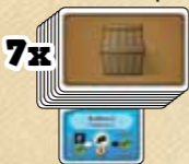
5 карт на руке и 7 угля